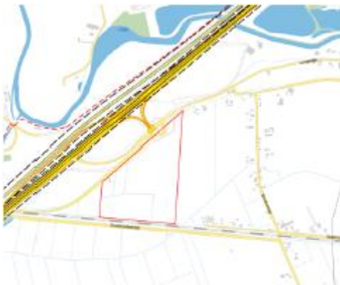
Risicokaart met plangebied rood omlijnd

Op onderstaande afbeelding is de locatie van het plangebied weergegeven ten opzichte van de relevante risicobronnen.