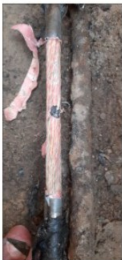
Foto 4 - Na reparatie