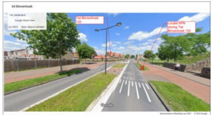
Foto 3 - Schadedetail